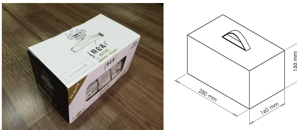
图1. 12盒装的特仑苏牛奶箱外形

搬运物品为可装12盒盒装特仑苏牛奶的箱体，箱体外形尺寸为280mm×160mm×150mm，箱体上表面有提带（比赛时将提带凸起（可内衬轻薄胶带固定），方便摘挂钩），提带宽度为15mm，如图1所示。箱体中横卧内置3盒250ml盒装特仑苏牛奶及已有的下层固定纸板，如图2所示，搬运物品总质量约为1.0 kg。