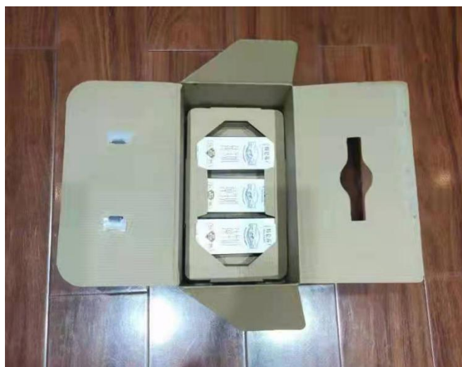
图2. 内置横卧3盒250ml特仑苏牛奶及下层固定纸板的箱体情况