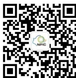
衍生式设计指导视频