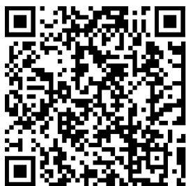
机械创意赛道动态

衍生式设计指导视频： http://www.eterc.cn/learningres/reslist.html